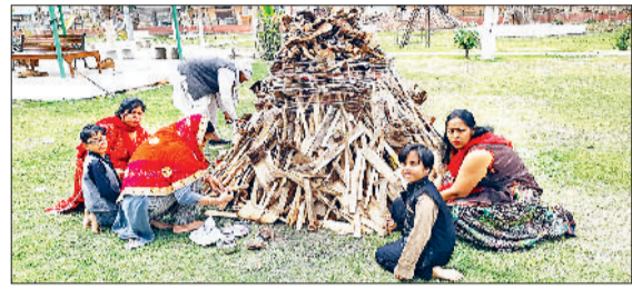
जींद। होलिका दहन से पहले पूजा करते हुए महिलाएं।