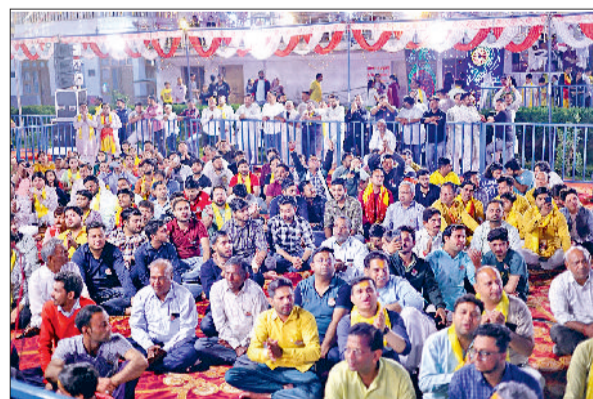
जींद। भजन सुनते श्रद्धालु।