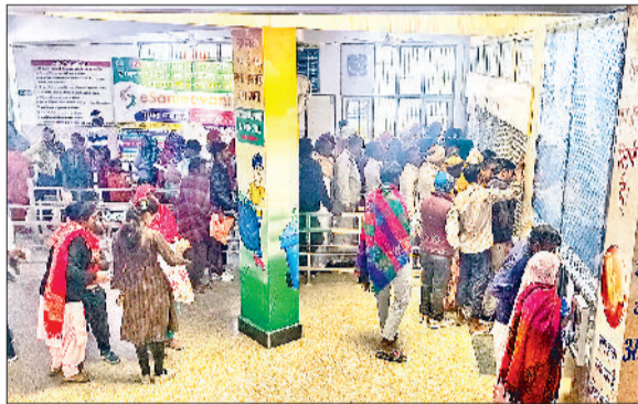
जींद। नागरिक अस्पताल में ओपीडी पर्ची के लिए लाइन में लगे लोग।

मौसम में लगातार उतार चढ़ाव का असर अब मानव शरीर पर होने लगा है। इस समय दिन के समय तापमान 32 डिग्री तक रह रहा जबकि शाम होते ही न्यूनतम तापमान 15 डिग्री रह रहा है। जिससे दिन के समय गर्मी तो रात के समय ठंड का अहसास हो रहा है। इस बदलते मौसम में वायरल, सर्दी, जुखाम, खांसी के मरीजों की संख्या बढ़ गई है। जिला मुख्यालय स्थित नागरिक अस्पताल की बात की जाए तो यहां प्रतिदिन 200 से 250 मरीज ऐसे पहुंच रहे हैं जिन्हें या तो बुखार है या फिर सर्दी या खांसी की शिकायत है। ऐसे में अस्पताल प्रशासन द्वारा भी संदिग्ध मरीजों के टेस्ट करवाए जा रहे हैं। इसके अलावा प्राइवेट अस्पतालों में भी मरीजों की अच्छी-खासी संख्या है। इस समय मौसम ऐसा बना हुआ है कि दिन के समय तो लोगों को तेज गर्मी महसूस हो रही है और रात के समय ठंडी हवा बहने के कारण लोग ठंडक भी कर रहे हैं और लोग वायरल की चपेट में आ रहे हैं। जिसके चलते लोगों के शरीर में दर्द के साथ सर्दी, जुखाम, तेज बुखार, गले में खराश और दर्द, सिर दर्द, खांसी, उल्टी, एलर्जी की शिकायत लेकर निजी तथा नागरिक