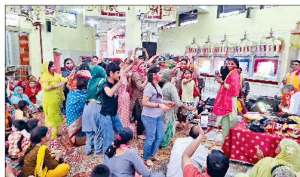
जींद। जयंती मंदिर में आयोजित होली महोत्सव के दौरान झूमती महिला श्रद्धालु।