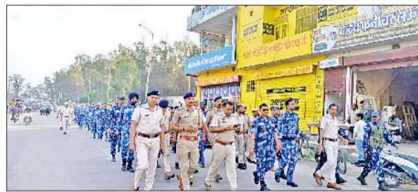
कलायत। फ्लैग मार्च निकालते सुरक्षा बल।

सर छोटूराम मैमोरियल सोसायटी, रोहतक छोटूराम पार्क, रोहतक-124001 (हरियाणा)